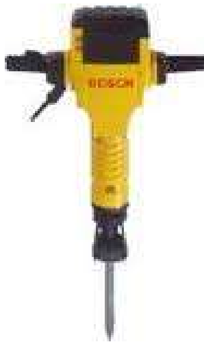
le marteau perforateur