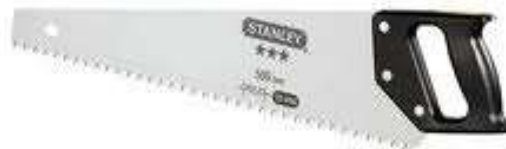
la scie égoïne