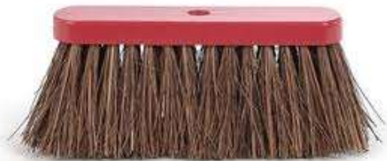
la brosse de rue