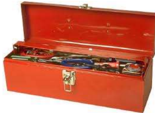
le coffre à outils