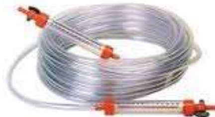
le tuyau flexible