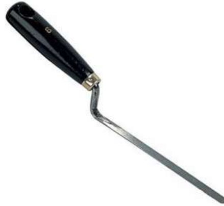
le fer à joints