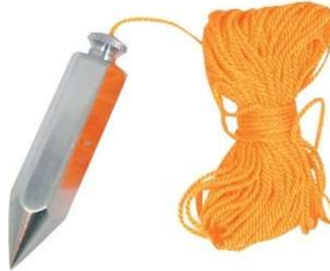
le fil à plomb