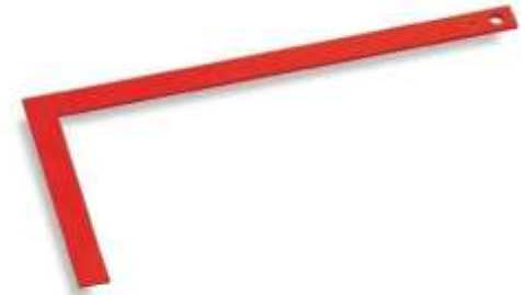
l'équerre de maçon