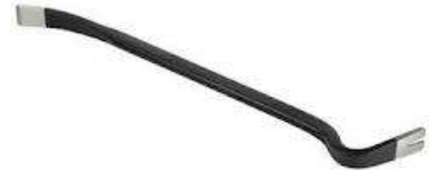
le pied de biche