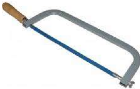
la scie à métaux