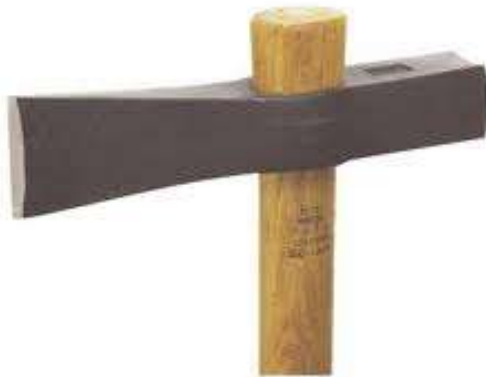
le marteau de maçon