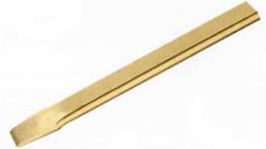
le burin plat