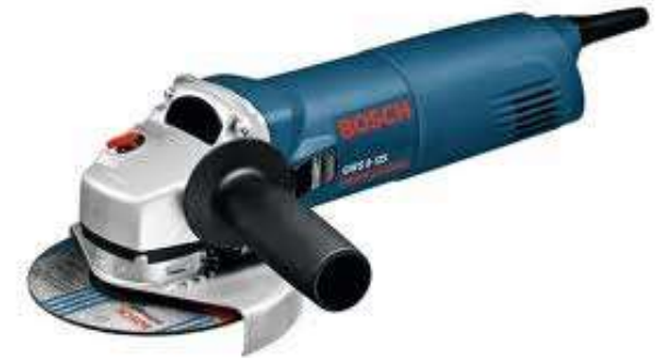
la meuleuse d'angles