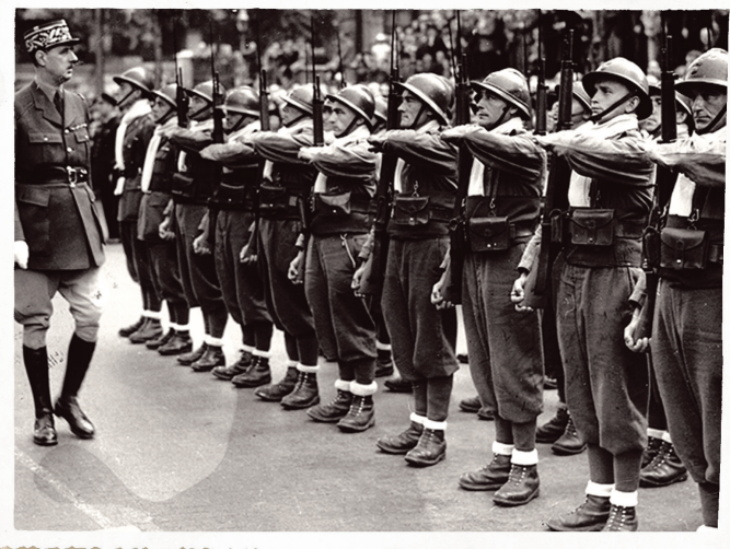
Le général de Gaulle passant en revue les premiers hommes des Forces françaises libres à Londres, le 14 juillet 1940.

Voici un extrait de l'Appel : « J'invite les officiers et les soldats français qui se trouvent en territoire britannique ou qui viendraient à s'y trouver (...) à se mettre en rapport avec moi. » Le but du général est de construire une armée pour la reconquête. Mais la population française a pris cet appel pour son propre compte. L'idée que la population française puisse être utile prendra un certain temps à être acceptée par de Gaulle, ainsi que par les Anglais. Encourager une sorte de guérilla civile n'est pas sans risque. Les objectifs des premiers agents spéciaux envoyés sur le sol français seront donc des actions de sabotage et d'espionnage, réalisées entièrement entre militaires. Des agents seront ensuite formés spécifiquement pour aider la Résistance, ce qui explique leur envoi tardif.