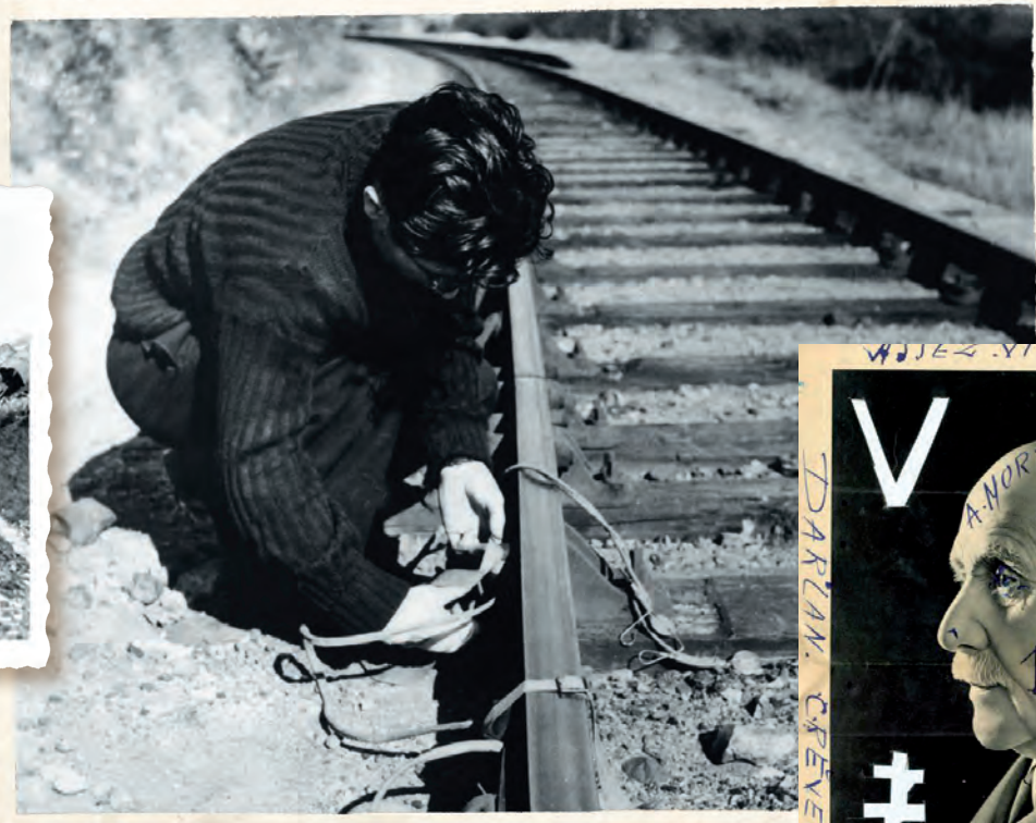
Graffiti sur une affiche de propagande du maréchal Pétain.