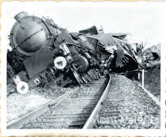
Acte de sabotage de la Résistance contre les transports allemands en Saône-et-Loire en 1944.