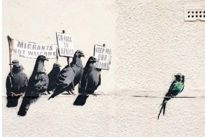
Graffiti de Banksy à Clacton-on-Sea (2)