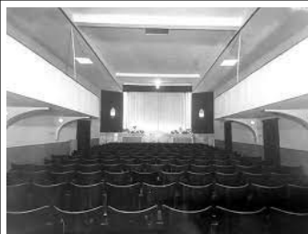
Aller au cinéma