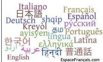
La possibilité d'avoir ta propre culture, de parler ta langue, de pratiquer ta religion et de ne pas avoir de religion