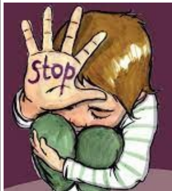
La protection contre les mauvais traitements et la négligence