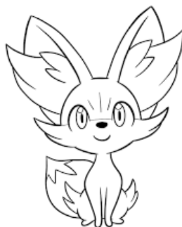
Des cartes Pokemon