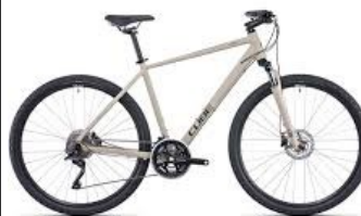
Un vélo à la mode