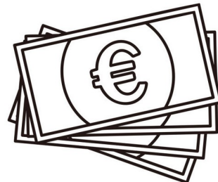
De l'argent à dépenser