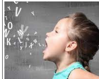
La possibilité de t'exprimer