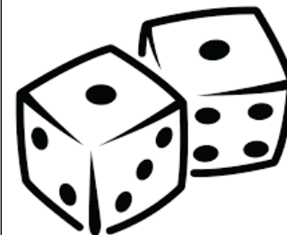
Avoir des loisirs