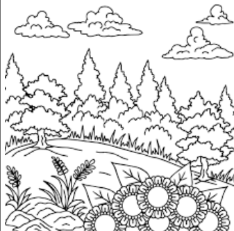
De l'air pur