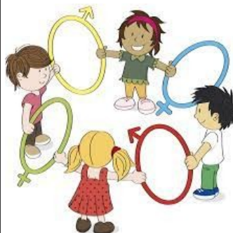
Un traitement équitable et la protection contre la discrimination