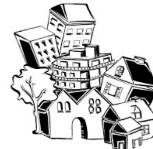
Un bon logement