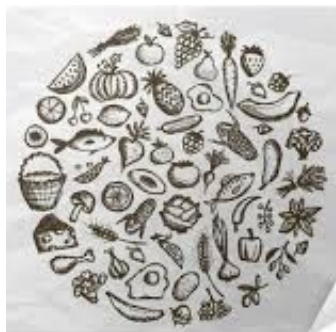
De la nourriture saine