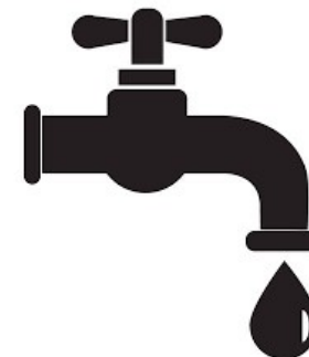
De l'eau potable