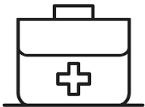
Des soins de santé