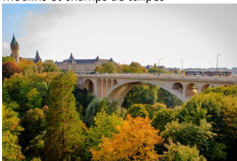
Le pont Adolphe