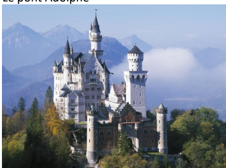
Le château de Neuschwanstein

(Il a inspiré le château de la Belle au bois dormant à Disneyland.)