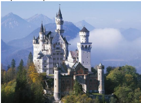
Le château de Neuschwanstein

(Il a inspiré le château de la Belle au bois dormant à Disneyland.)