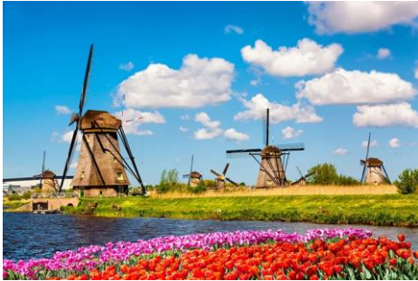
Moulins et champs de tulipes