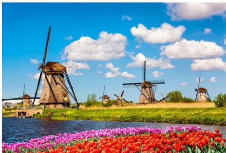
Moulins et champs de tulipes