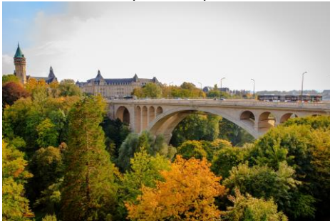
Le pont Adolphe