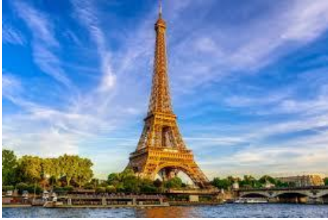
La tour Eiffel